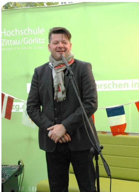
Der Zittauer Oberbürgermeister Thomas Zenker freut sich über das Engagement junger Menschen in seiner Stadt.

Am 30. Oktober 2019 wurde die Zittauer BücherboXX im Beisein aller an ihrer Entstehung beteiligten Personen und Einrichtungen sowie des Stadtoberhauptes und der Leitung der Hochschule Zittau/Görlitz auf dem Markt in Zittau im Rahmen eines Eröffnungsprogramms feierlich eröffnet.