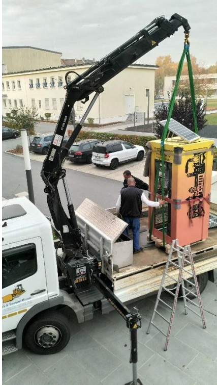
Abholung der fertiggestellten BücherboXX vom Hochschulgelände (l.). Auszubildende der Kooperativen Ingenieurausbildung der HSZG bei letzten Montagehandgriffen am endgültigen Standort der BücherboXX auf dem Zittauer Markt (u.)