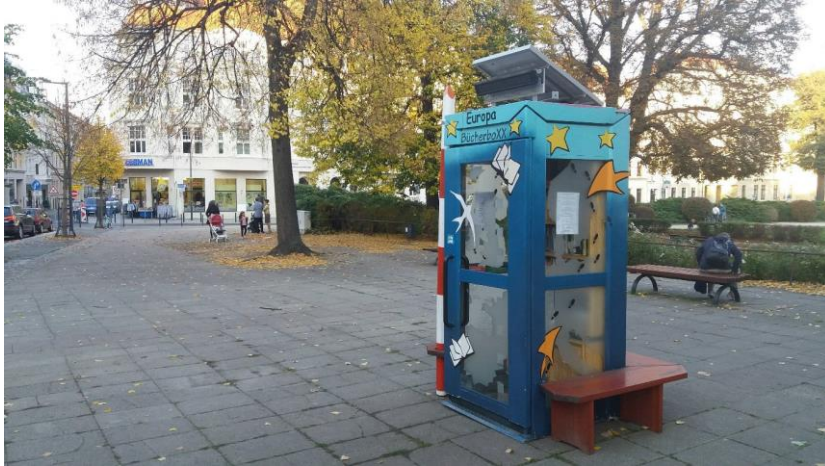
Die Probe-BücherboXX auf dem Wilhelmsplatz in Görlitz.