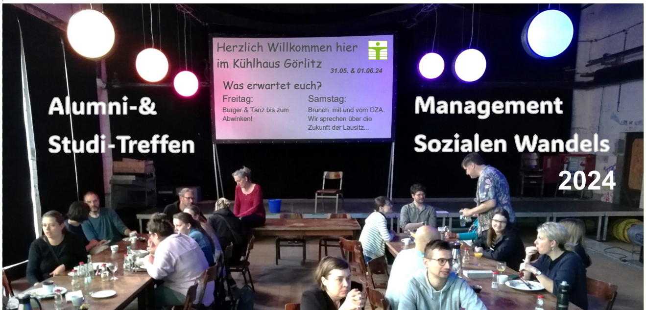
Bevor das Gespräch über die Chancen und Möglichkeiten des DZA in der Lausitz begann, wurde sich beim Brunch gestärkt.